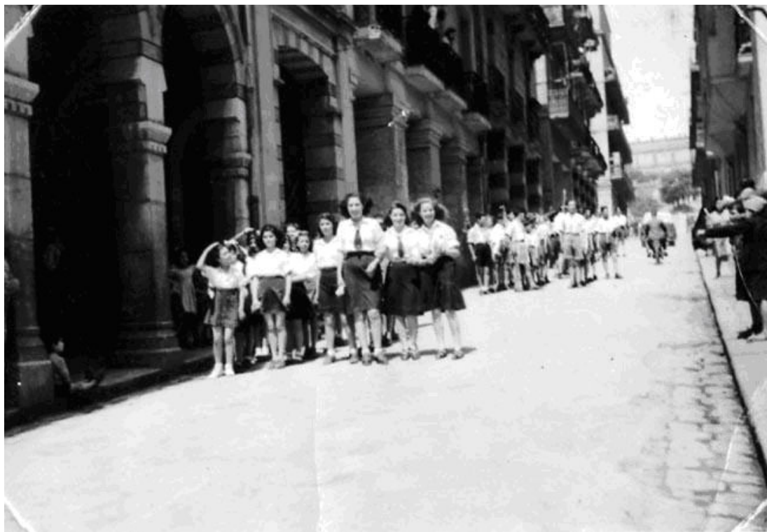
Devant le Midrash le 11 mai 1947