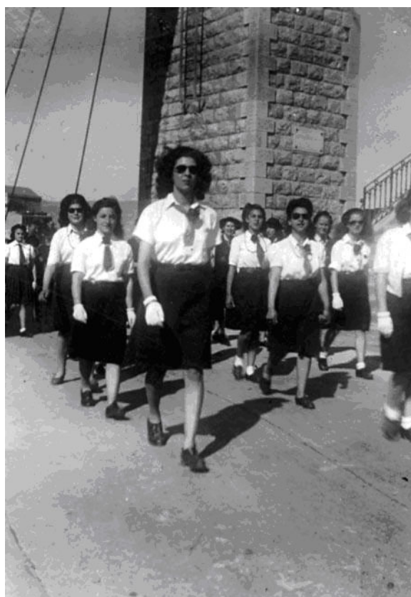
Défilé devant le pont suspendu Année 1947