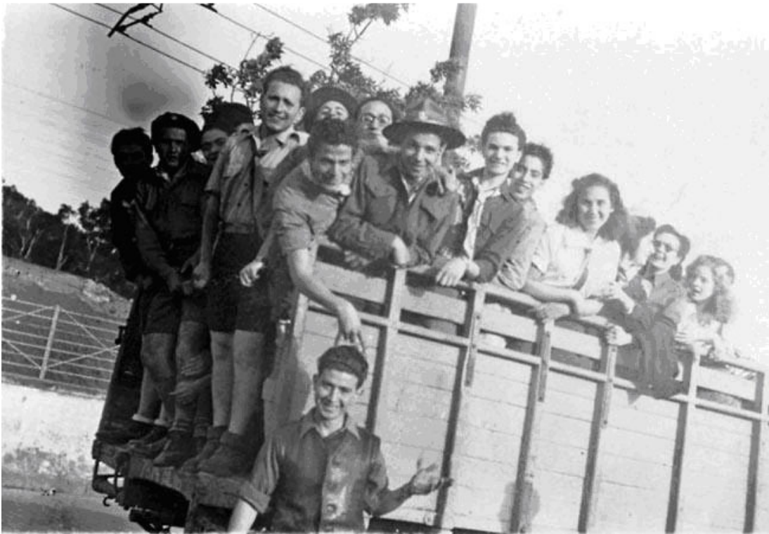
Départ en direction du camp du Kroubs, sur la route de Sidi Mabrouk le 6 avril 1948