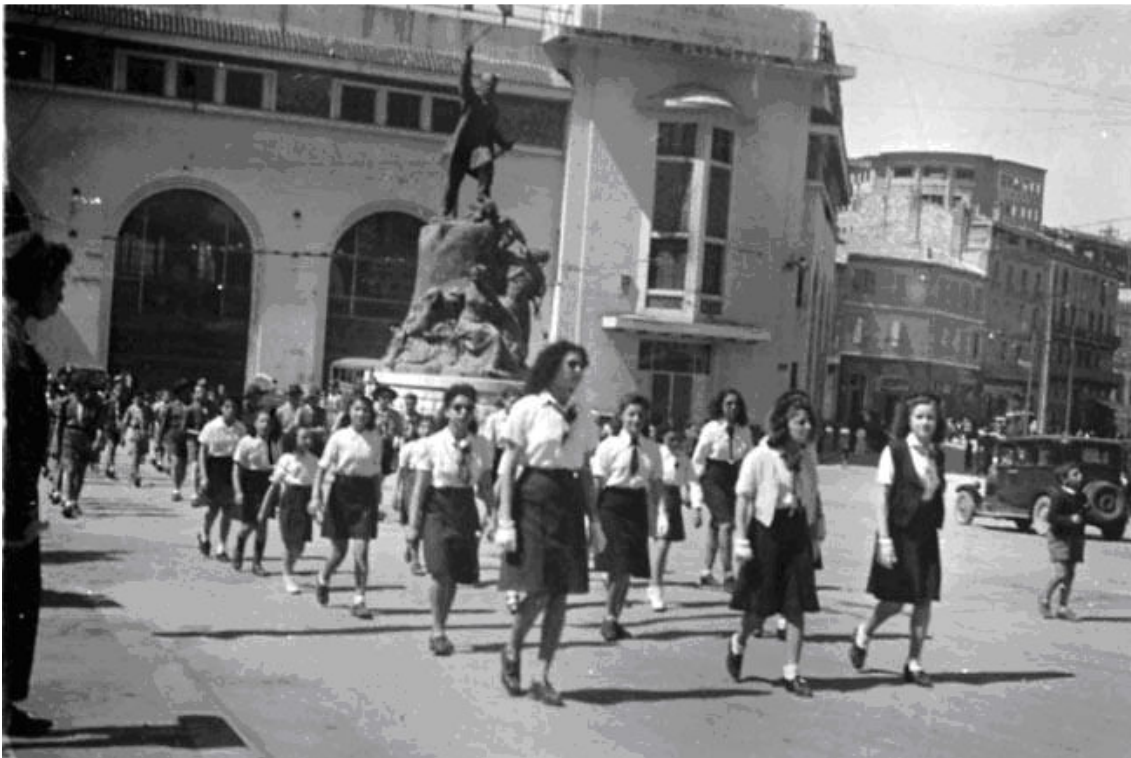
Défilé place du Général Lamoricière.

On aperçoit la statue du Général Lamoricière, au fond le garage Citroën devenu depuis les bureaux d'Air Algérie.